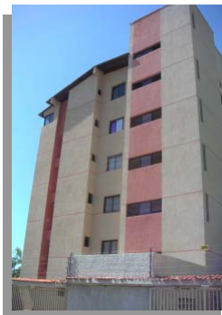
CONDOMINIOS: ANTES Y DESPUES